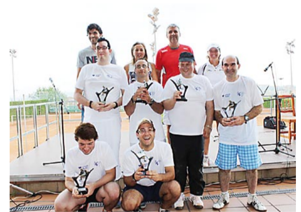
Alumnes de Sil Taina