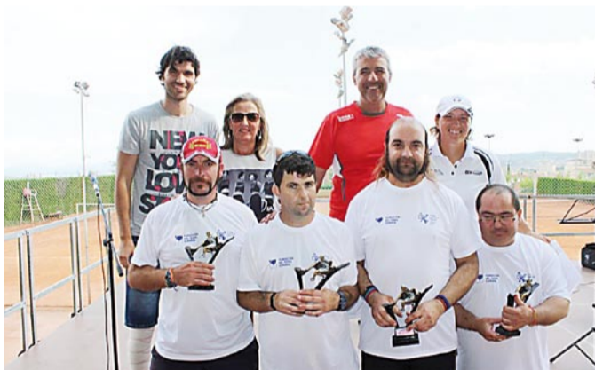
Alumnes de CIPO