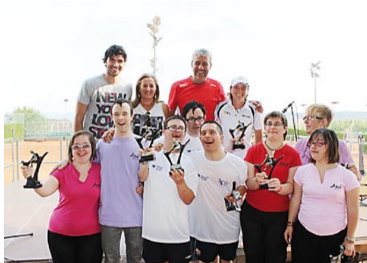
Alumnes d'Andi Down Sabadell

El passat dissabte a la tarda, després de la darrera classe conjunta de les diferents associacions que participen en el programa 'Esport per a tothom', es va celebrar el repartiment de diplomes i el sorteig de regals amb la presència de Pau Castañé, seleccionador nacional de tennis per a discapacitats, de Pablo Ruiz, jugador de futbol del Centre d'Esport Sabadell, i de l'Asunción López, vicepresidenta de l'àrea social del Club Tennis Sabadell.