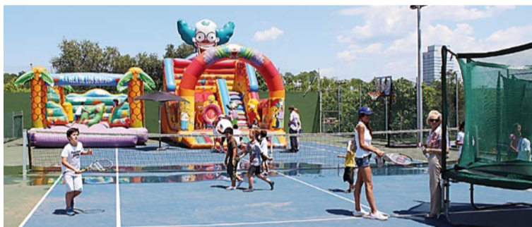
Inflables i grup de l'Escola de pàdel