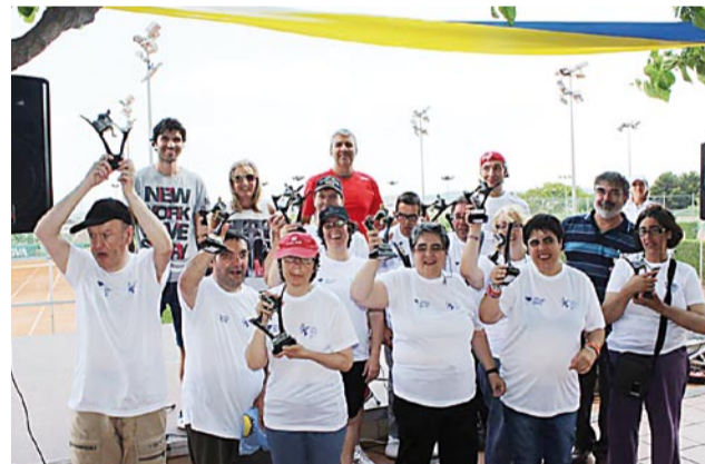
Alumnes de la Fundació Atendis