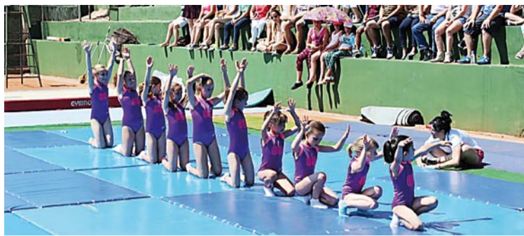
Gimnastes més petites